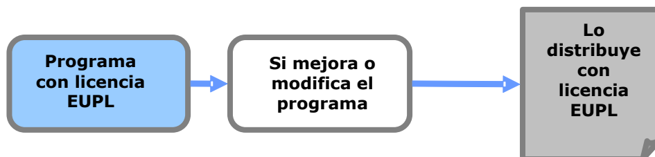
Ilustración 1: Efecto copyleft

Si usted ha creado una obra derivada (lo que quiere decir que ha modificado el programa de ordenador, añadido funcionalidades, traducido la interfaz a otra lengua, etc.) y distribuye esta nueva obra, también debe aplicar la misma licencia EUPL (sin modificar sus condiciones) a la obra derivada final.