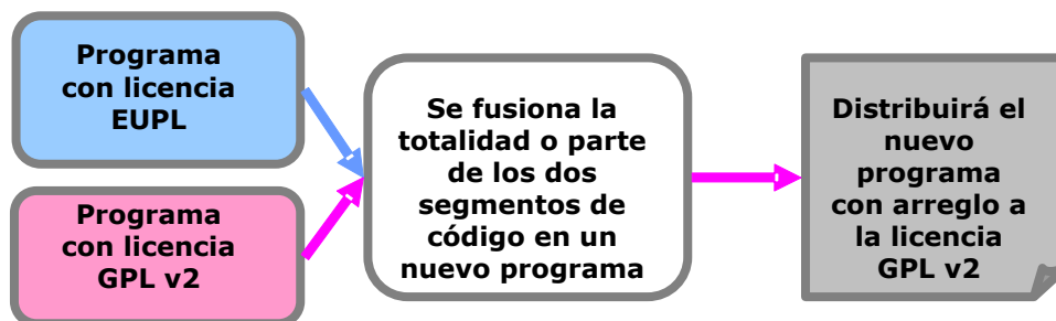
Ilustración 2: Cláusula de compatibilidad

redistribuirla conforme a las condiciones de la GPLv2, pues así lo exige esta licencia, que es « copyleft ». La EUPL resuelve el «conflicto de licencias» autorizándole a cumplir dicha obligación.