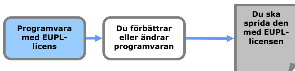
Figur 1: "Copyleft"-effekt

Om du har skapat ett härlett verk (vilket innebär att du har gjort ändringar i programmet, lagt till funktioner, översatt gränssnittet till ett annat språk osv.), och om du sedan sprider detta nya verk måste du också tillämpa samma EUPL-licens (utan att ändra licensvillkoren) för hela det avledda verket.