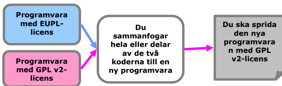
Figur 2: Kompatibilitetsklausul

Tänk på att när du bygger programlösningar med olika Open Source-komponenter är det sällan obligatoriskt att sammanfoga eller länka deras kod i en enda källa. De olika komponenterna i lösningen brukar utbyta och bearbeta parametrar utan att sammanfogas. Då kan också varje komponent i lösningen förbli licensierad enligt sin originallicens.