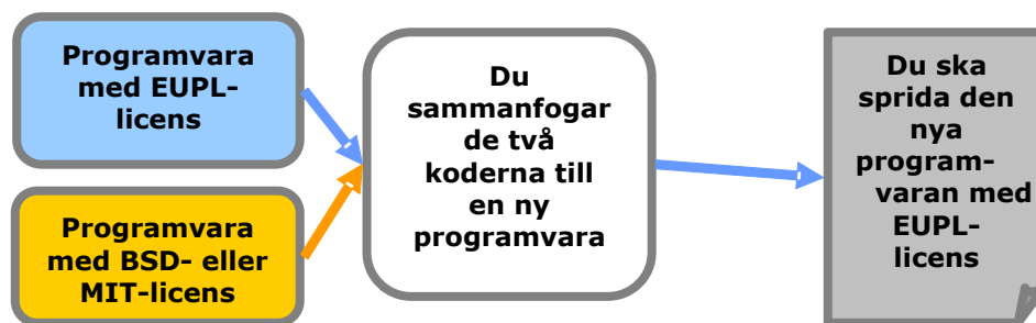
Figur 3: Sammanfogning med tillåtande källkod

Om du bestämmer dig för att sprida det härledda verket ska du göra det enligt villkoren i EUPL. Det är en skyldighet som uppstår genom artikel 5 i EUPL (copyleft-klausulen).